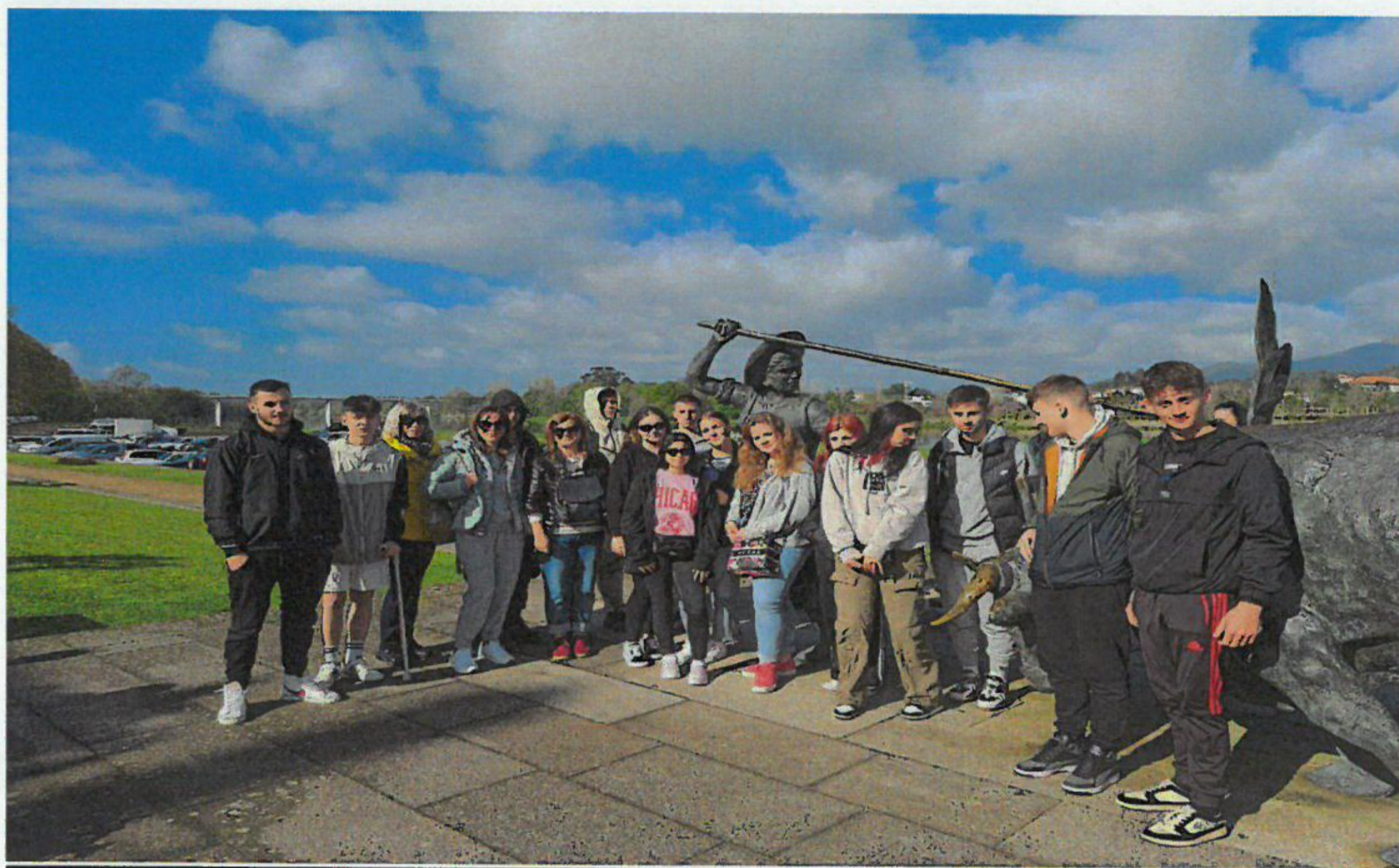
Arcos de Valdevez – relaxare pe malul râului, degustare de produse tradiționale.